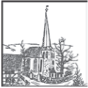
Ev. Kirche Volberg Hoffungsthal

DER EVANGELISCHEN GEMEINDE VOLBERG - FORSBACH - RÖSRATH