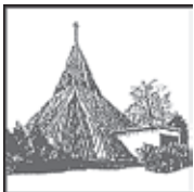
Kolumbarium Kreuzkirche Kleineichen